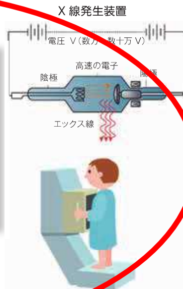
(出典) 放射線による健康影響等に関する統一的基础資料（平成29年度版）