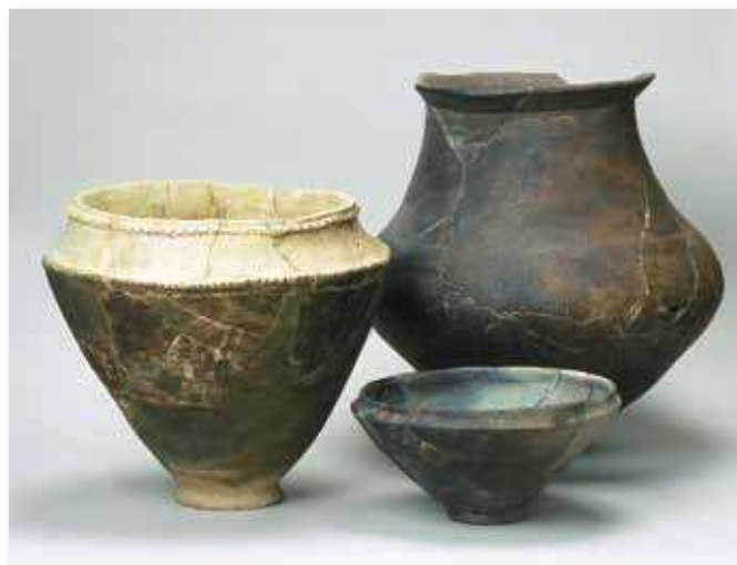
福岡市の板付遺跡や有田七田前遺跡から出土した土器

古い土器には昔の人が使っていた時に付着したススやコゲが残っていることがありますが、このススやコゲの中には放射性物質である炭素14などが含まれています。放射性物質の量は時間が経つにつれ減っていくことから、炭素14などの放射性物質の半減期を利用してその土器が使用された時期を知ることができます。