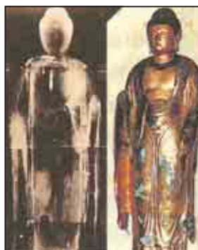
仏像を壊さずに内部を調査

これは、土器などに含まれている炭素14の長い半減期(5730年)を利用して年代を測定する方法です。