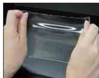
水分を保つ傷当て材