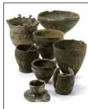
土器などの年代測定